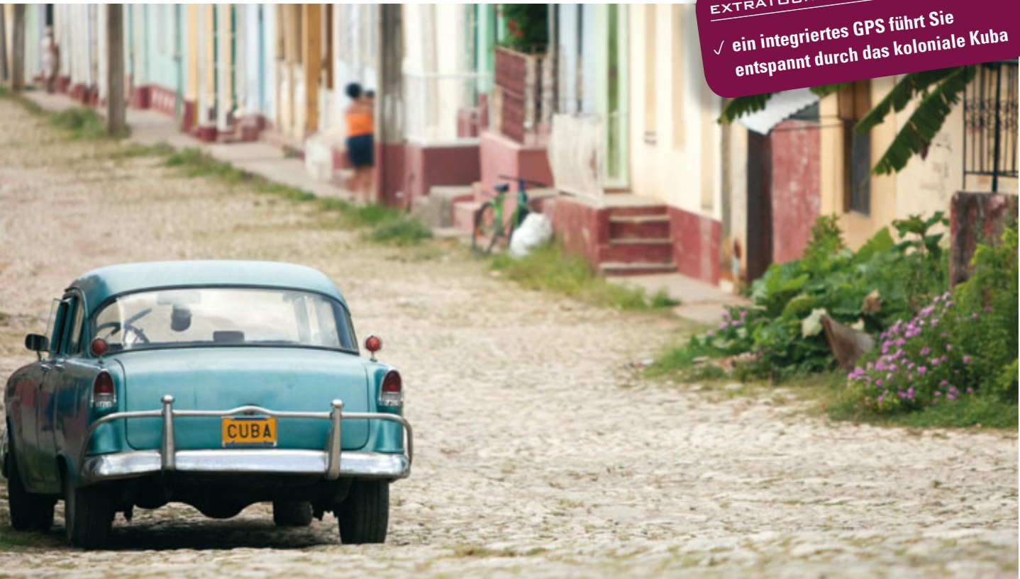
Oldtimer in Trinidad

✓ ein integriertes GPS führt Sie entspannt durch das koloniale Kuba